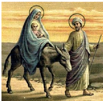
Svatá rodina – vzor křesťanských rodin

Hodnota rodiny a manželství, zvláště postavení dětí či starých lidí, rodiny v obtížné situaci. O těchto tématech hovořil papež František s účastníky plenárního zasedání Papežské rady pro rodinu, které proběhlo ve dnech 22. - 25. října 2013 v Římě. „Rodina je místem, kde se člověk učí milovat, je přirozeným středem lidského života. Osobnost každého z nás se utváří v rodině. Rodina je místem, kde se učíme umění dialogu a vzájemné komunikace. Toto všechno je rodina, která vyžaduje, aby byla uznána. O to více dnes, kdy převažuje ochrana práv jednotlivců. Musíme bránit právo tohoto společenství, jímž je rodina.“ „Manželská a rodinná láska jasně ukazuje povolání člověka milovat jedinečným způsobem a navždy. Ukazuje také, že zkoušky, oběti a krize manželů nebo i celé rodiny jsou přechody, skrze něž rosteme v dobrou, pravdu a krásu. Je to zkušenost víry v Boha a vzájemné důvěry, hluboké svobody, svatosti, protože svatost předpokládá věrné darování sebe sama a obět v každém dni života!“ Dvěma póly rodiny, které chtěl papež František zdůraznit, jsou dětství a staří. Právě o tyto je třeba především pečovat: „Děti a staří lidé jsou dvěma póly života. Často jsou těmi nejzranitelnějšími. Společnost, která opouští děti a vytla-